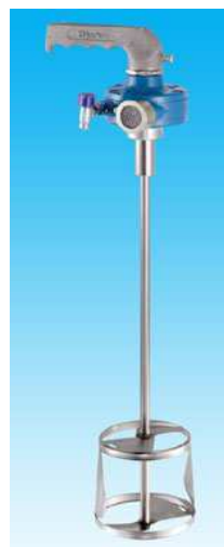
149-873 - Mélangeur rapide BINKS