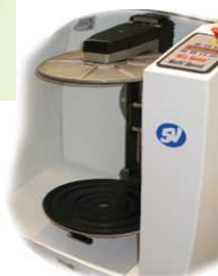
Agitateur gyroscopique MULTISPEED