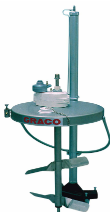
231414 - Kit mélangeur + élévateur pour fût de 200 l