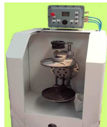
Agitateur gyroscopique SATURNO

Poids 40 Kg Diamètre maxi 380 mm Hauteur maxi 500 mm Cycles automatiques ou manuels 3 Vitesses