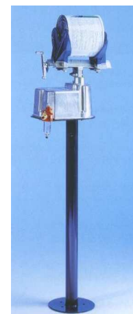
54-900 Agitateur pneumatique de bidon 5l