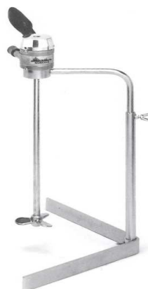
AGI001 - Agitateur pneumatique fixe et mobile 0,2 kW